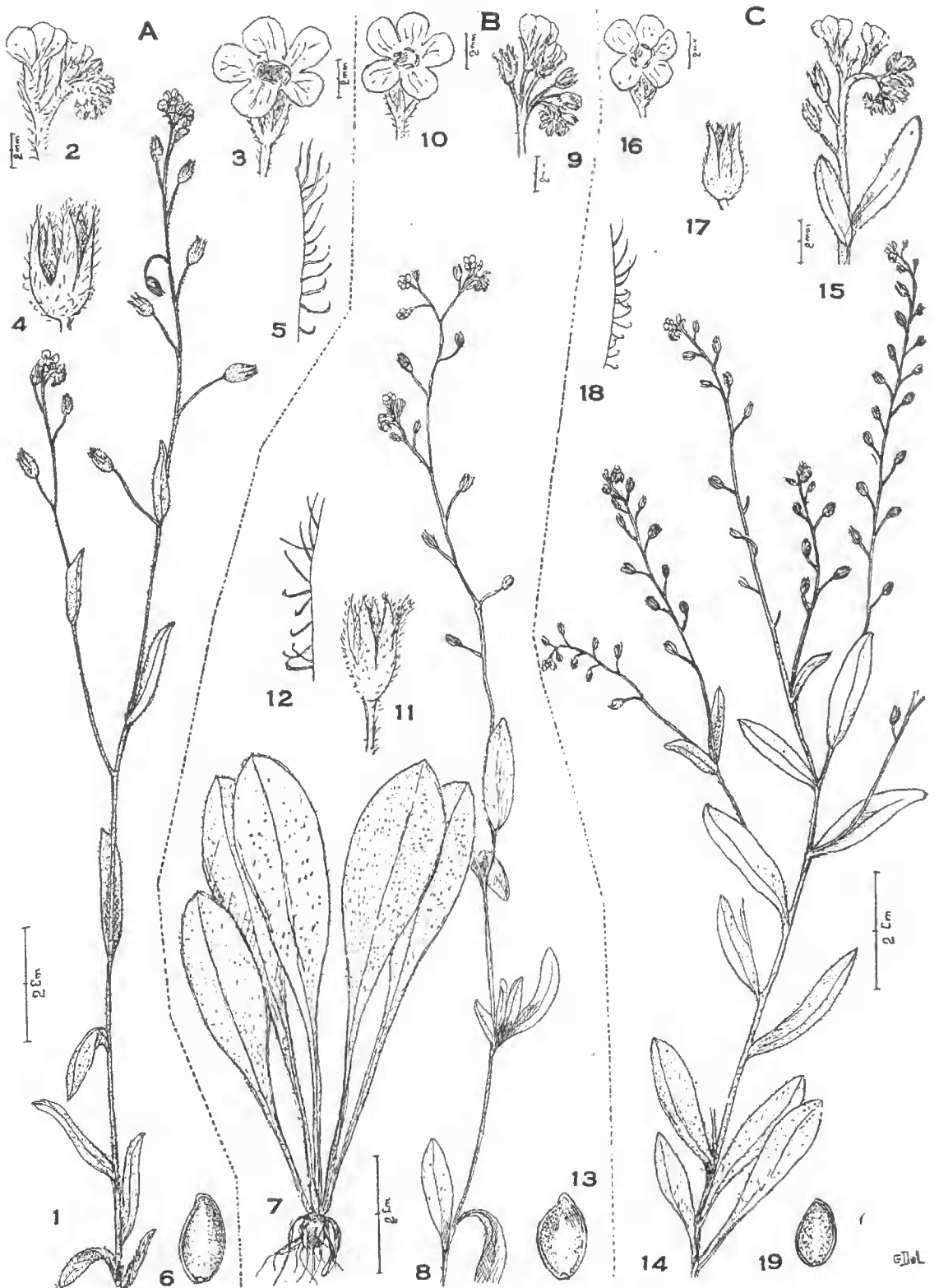
PL. 2. — A Myosotis arvensis type (Herb. Muséum n° 344). — 1. Tige avec fleurs ; 2. Groupe floral ; 3. Une fleur ; 4. Un calice ; 5. Poils du calice très grossis ; 6. Une graine (1 mm. 5).

B. Myosotis umbrata . — 7. Fragment d'une touffe de feuilles ; 8. Tige avec fleurs ; 9. Groupe floral ; 10. Une fleur ; 11. Un calice ; 12. Poils du calice très grossis ; 13. Une graine (1 mm. 5).